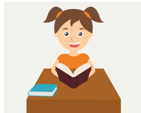
Fazer as tarefas