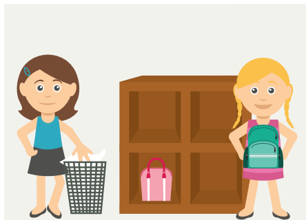
Organizar a sala