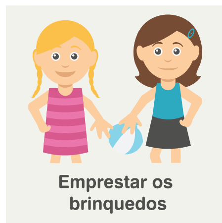
Emprestar os brinquedos