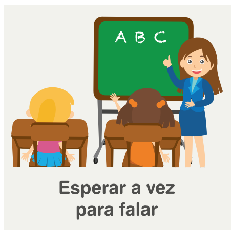
Esperar a vez para falar