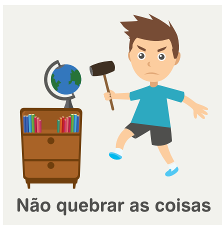
Não quebrar as coisas